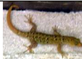
Isla Iguana, 21 abr 2007

Observaciones (hábitat, abundancia y notas del autor):