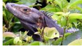
26/sep/03, Isla Iguana

Observaciones (hábitat, abundancia y notas del autor): Frecuente en los bosques, áreas abiertas y playas de Isla Iguana; frecuente en los bosques, manglares y áreas abiertas de la península, pero poco común en las playas contienteales. Sus poblaciones han disminuido significativamente por la cacería en toda la Península de Azuero.