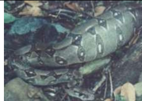
sitio de anidamiento de tijeretas, Isla Iguana, 14/abr/1990

Observaciones (hábitat, abundancia y notas del autor): Rara en Isla Iguana y poco común en los bosques y áreas abiertas de la península. En Isla Iguana, es más fácil encontrarla entre los nidos de las tijeretas. En las zonas rurales de la península puede encontrarse en los techos de las casas y graneros. Evitan el encuentro con humanos. Su camuflaje hace difícil verlas en la densa vegetación.